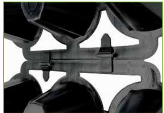
Espaciador corto 4 cm