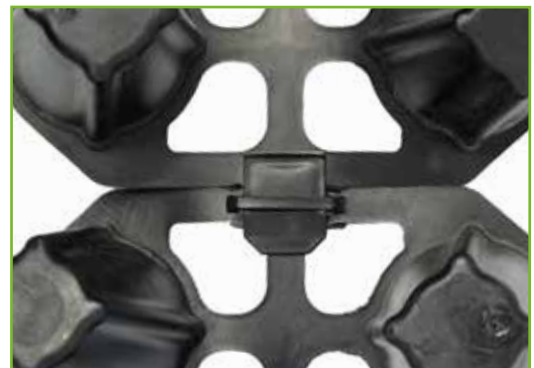
Espaciador largo 6 cm