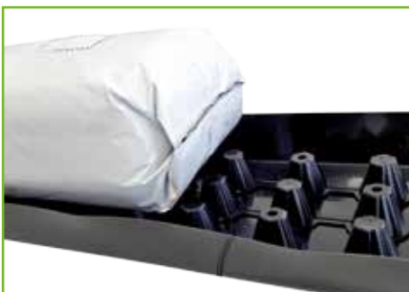
Espaciador largo 6 cm

1.600 metros/palet Palets/camión: 33 (52.000 metros/camión)