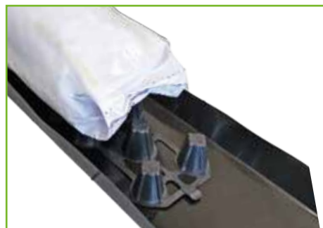
Espaciador corto 4 cm